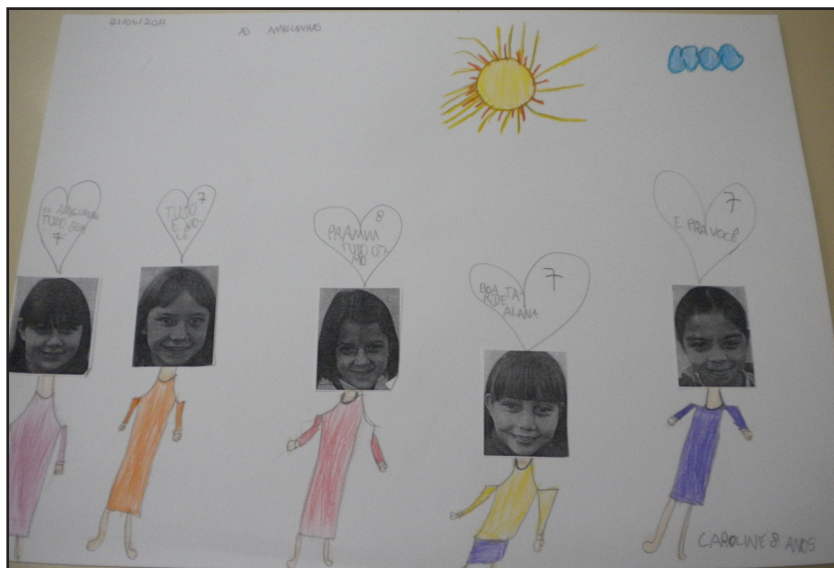
FIGURA 2: História em quadrinhos com as fotografias dos alunos

Mesmo que as produções tenham ficado em uma página e o uso de poucos detalhes na constituição de cenário, podemos observar a representação das falas em balões caracterizando o gênero explorado.