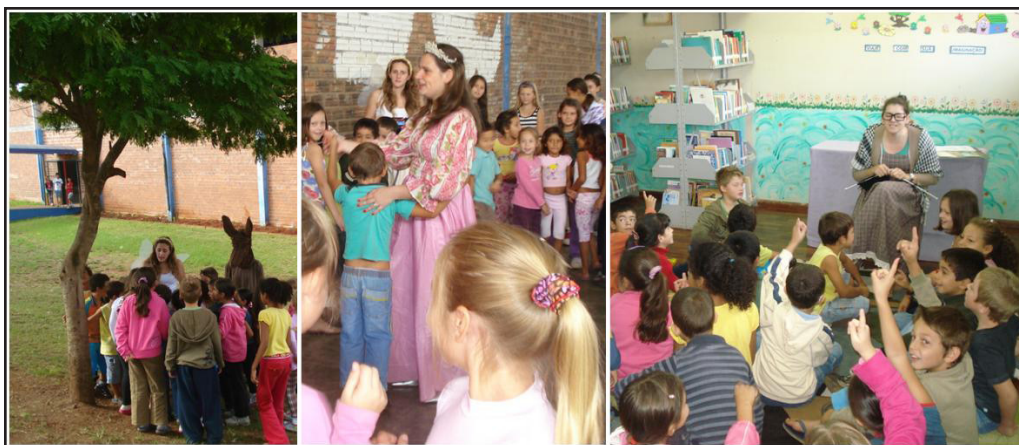
FIGURA 1: História Planalto encantado

● Contação da história “Planalto encantado” (FIGURA 1), com encenação de alguns personagens e trilha enigmática envolvendo as crianças na busca do final da história. A dinâmica busca o envolvimento das crianças cognitiva e emocionalmente com a história e os personagens. Além disso, é preciso ler e discutir as pistas enigmáticas e chegar a um consenso para resolver cada uma das questões. A estratégia proporcionou aos expectadores a manifestação da criatividade, ao mesmo tempo em que requereu o exercício de atenção, interpretação e coesão textual, na medida em que as ideias precisavam fazer sentido e dar sequência ao texto original. Nesse processo, os alunos foram desafiados a se assumirem como coautores da história e atores da peça teatral, pois, ao expressarem suas ideias, alteraram o rumo daquela. Possibilitar ao leitor interagir com o texto, às vezes decidindo o percurso da leitura, outras vezes possibilitando-lhe acrescentar novos trechos, encontra-se bastante presente na sociedade atual, especialmente nos meios digitais, sendo característica de alguns gêneros textuais emergentes.