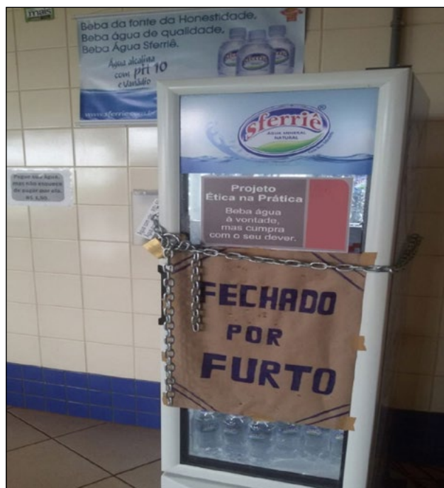
Figura 2 – Foto do lacramento da geladeira na primeira edição (2016)

e fixação de um cartaz com informação clara sobre o motivo do fechamento, conforme Figura 2 abaixo.