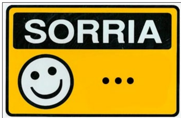
Figura 4 – Placa informativa afixada na porta da geladeira.