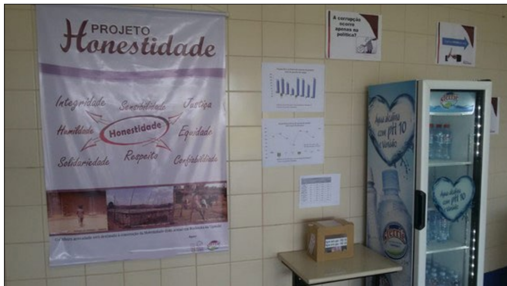
Figura 1 – Foto do projeto implantado em 2018