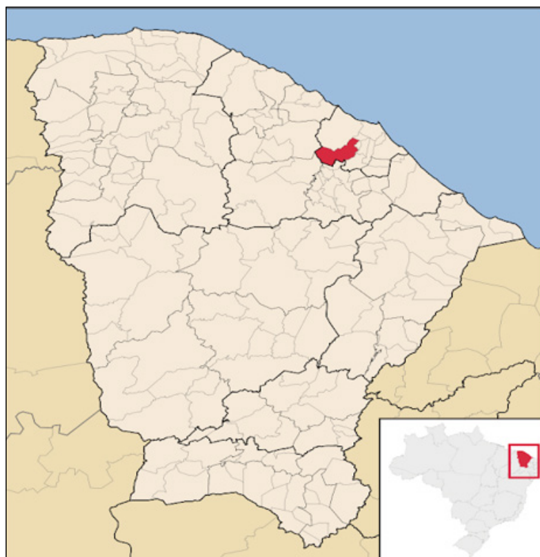
Figura 1 – Localização de Maranguape no estado do Ceará