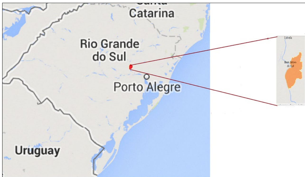
Figura 3 – Mapa de localização do município de Bom Retiro do Sul, RS

A Barragem Eclusa de Bom Retiro do Sul permite a ligação hidroviária desde o porto rodo-hidro-ferroviário de Estrela até os portos de Porto Alegre e Rio Grande, entre outros (FERRI; TOGNI, 2012, p. 198).