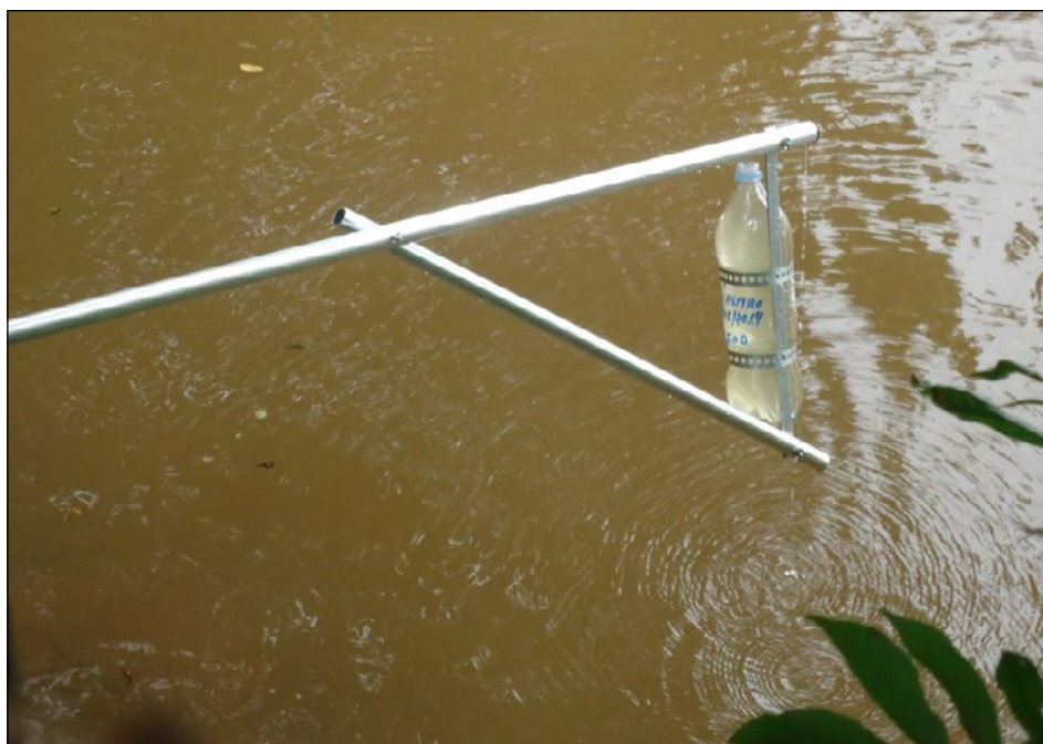
Figura 2 – Frasco de PET utilizado para coletar amostras nos quatro pontos analisados no rio Taquari

Para as coletas de água foram utilizados frascos de politereftalato de etileno (PET), devidamente limpos e identificados, contendo volume de 2.000 mL. A água foi coletada a cerca de 40 cm de profundidade em todos os pontos (FIGURA 2). Foi efetuada a medição da temperatura da água nos pontos, com termômetro de coluna de mercúrio.