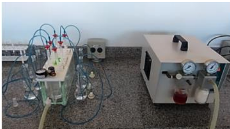
Figura 2 - Soluções de cefalexina sendo pré-concentradas pela SPE.