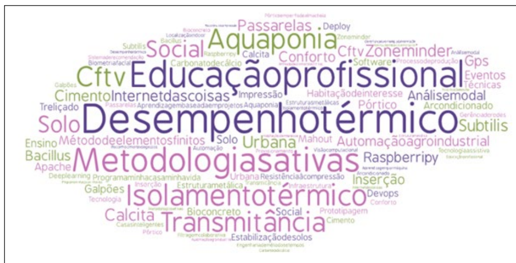
Figura 1 - Nuvem de palavras com as palavras-chaves dos artigos seleccionados 1

Por aqui, nos adaptamos rapidamente para continuar estudos e pesquisas com segurança. Nesse sentido, a Revista Destaques Acadêmicos da Universidade do Vale do Taquari - Univates, em sua quarta edição de 2020, apresenta 19 artigos ligados à área de Ciências Exatas e Tecnológicas, de forma a contribuir com a disseminação da Ciência e da Tecnologia. Os artigos abordam uma variedade de temáticas que podem ser conferidas na Figura 1, escritos por estudantes, professores e pesquisadores.