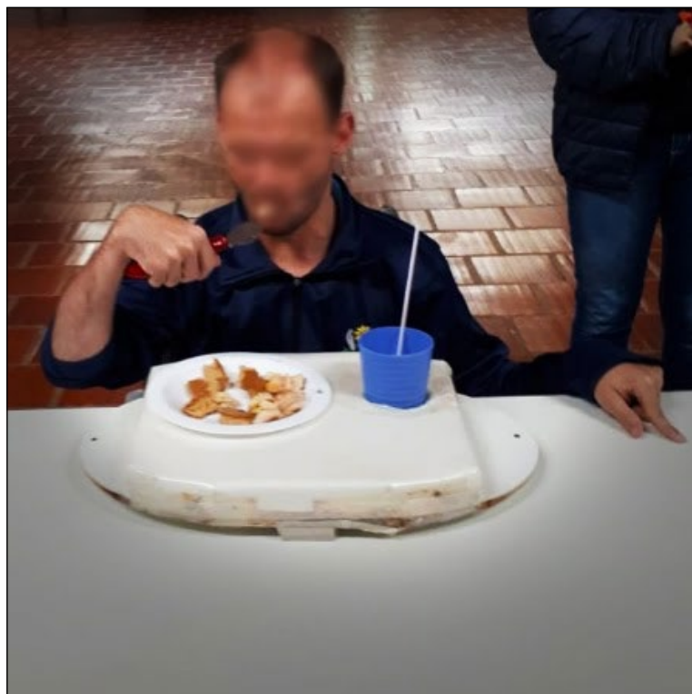
Figura 4. Aluno com PC utilizando colher desenvolvida em impressão 3D.