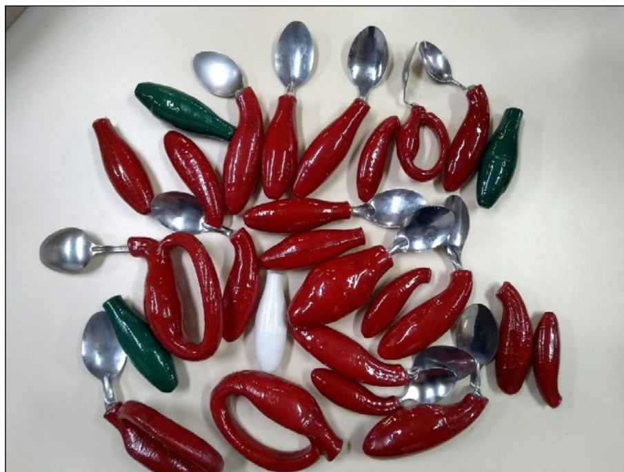
Figura 3. Colheres com cabos produzidos utilizando impressão 3D.

Após a impressão das colheres, as mesmas foram distribuídas aos respectivos alunos com PC da APAE e testadas. Foi observado que houve boa adaptação e utilização das colheres pelos alunos, auxiliando na sua independência para se alimentar. As colheres produzidas são apresentadas na Figura 3.