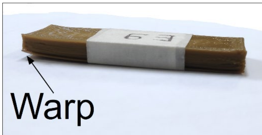
Figura 2 - Defeito de empenamento ( warping ) no corpo de prova de teste.