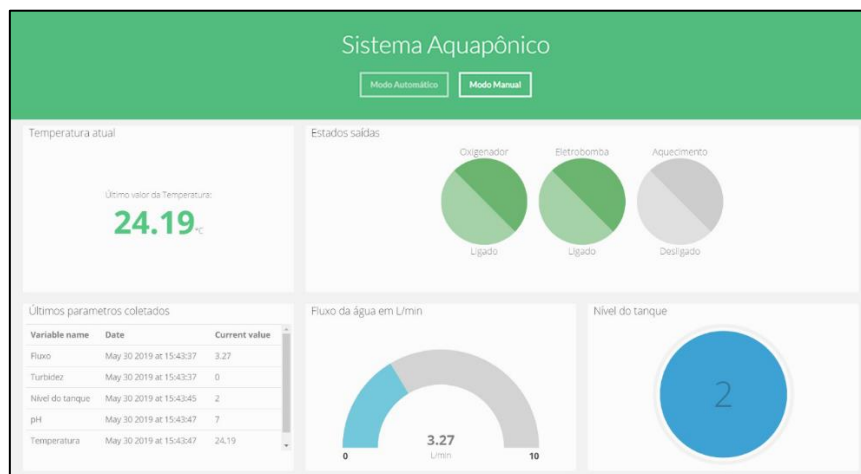
Figura 3 – Interface de acesso no modo automático de operação

A aplicação gerenciadora estará sempre coletando dados e enviando para a aplicação centralizadora, para que o usuário possa executar uma ação, controlando os parâmetros que interferem na qualidade da água. Quando a aplicação centralizadora é executada, o usuário receberá um menu principal que representa diretamente o sistema de automação no modo automático, onde é possível visualizar informações coletadas pelos sensores. A aplicação consiste em uma única camada, com o objetivo de simplificar e acelerar os usuários no monitoramento e controle. Na Figura 3 é apresentada a interface no modo automático de operação.