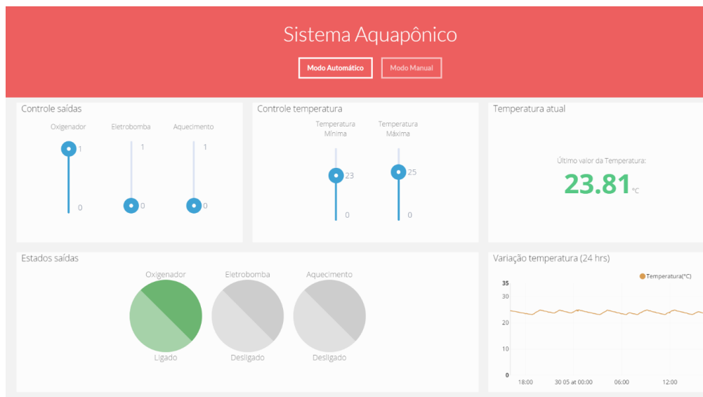
Figura 4 – Modo manual de operação

Para realizar ações ou interferir no sistema, o usuário deverá entrar no modo manual de operação, onde há um menu para obter o acesso detalhado para controlar os relés, como ligar ou desligar a resistência para aquecimento da água, as bombas de água, etc. Abaixo é demonstrado, por meio da Figura 4, a aplicação centralizadora no modo manual de operação.