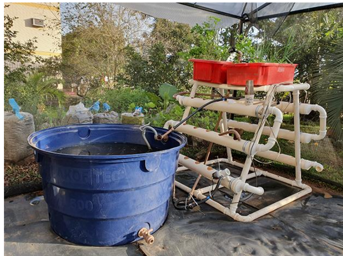
Figura 2 – Sistema aquapônico em funcionamento

Para a realização do trabalho, foi realizada a montagem de um sistema aquapônico. No sistema implantado, foi utilizada a união de sistema com cama de cultivo e NFT (cultivo em canaletas). Isso se dá pelos benefícios de ambas, eliminando as desvantagens se fosse aplicada somente uma técnica, como mostra a Figura 2.