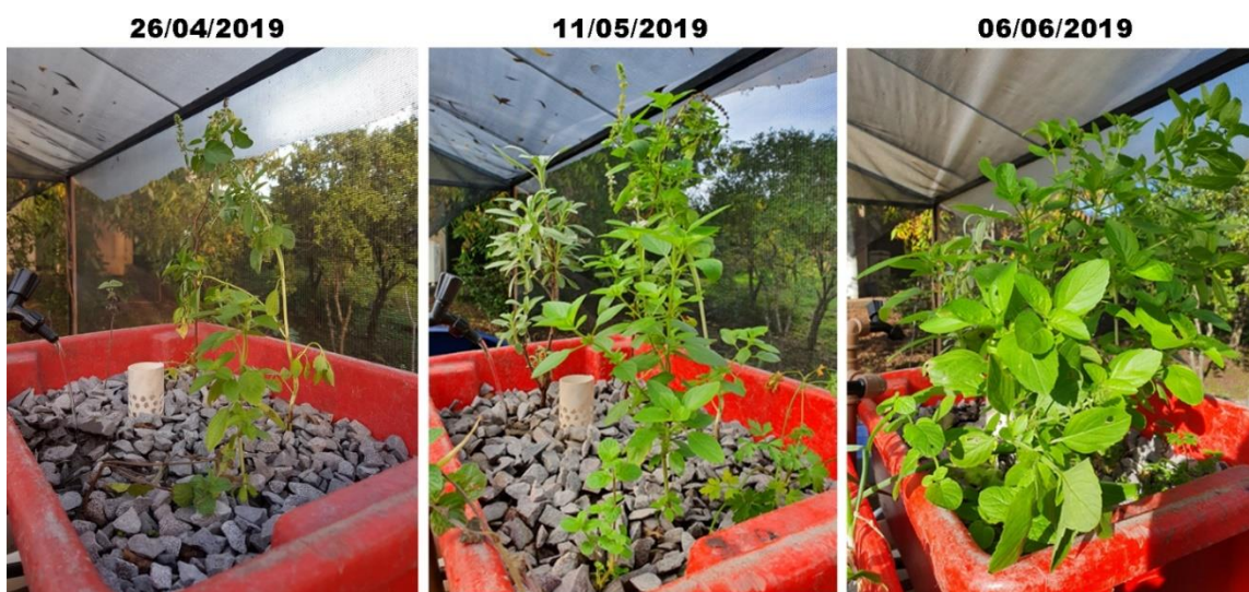
Figura 8 – Evolução das plantas durante período de teste

Percebeu-se que principalmente o controle da temperatura e do pH da água influenciaram diretamente no desenvolvimento e saúde dos peixes. Coletando os dados continuamente, assim podendo monitorá-los, facilita-se o manejo da qualidade da água, em consequência melhorando o ambiente em que os organismos se desenvolvem, que se demonstra a partir das Figuras 8 e 9.