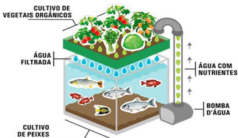
Figura 1 – Sistema básico de aquaponia

Além do desperdício mínimo de água, a aquaponia possui outras grandes vantagens como a alta taxa de produção de peixes e derivados de hortaliças, a criação tanto em áreas rurais como em centros urbanos, e a sustentabilidade no processo de produção, gerando um produto único, saudável e livre de agrotóxicos e antibióticos (CANASTRA, 2017; HUNDLEY; NAVARRO, 2013). A Figura 1 demonstra de forma básica como funciona um sistema aquapônico, bem como a aquicultura e a hidroponia se relacionam.