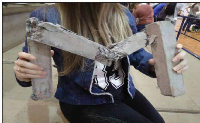
Figura 7 – Aparato de Proteção ao Ovo rompido