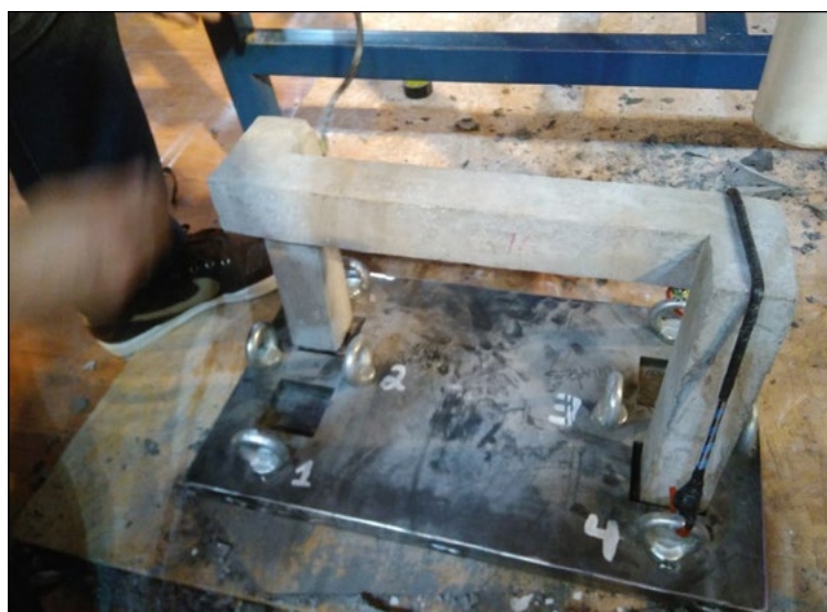
Figura 6 - Aparato de Proteção ao Ovo posicionado para execução do ensaio

Inicialmente o aparato foi posicionado sobre o gabarito, mas, infelizmente, uma das extremidades não encaixou perfeitamente, devido ao fato de moldar o pórtico duas vezes e a fôrma ter estufado; mesmo assim, o pórtico foi fixado com elásticos sob um cano de PVC, onde estava inserido o cilindro metálico com massa de 15 quilogramas. Na Figura 6 pode-se observar que o encaixe não ocorreu perfeitamente no local do número 2 pintado na base.