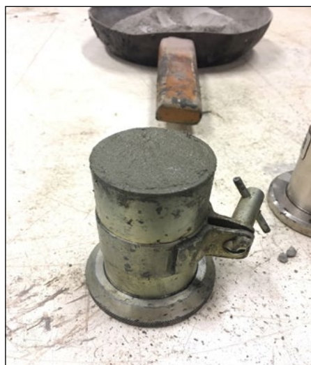
Figura 5 – Corpo de prova moldado para verificação da resistência

Com o concreto ainda fresco, tomou-se a decisão de retirá-lo da fôrma com cuidado para não danificar a fôrma e a armadura, e optou-se por realizar a concretagem novamente. Para isto, repetiu-se o mesmo traço inicial, apenas não havendo a adição de nenhum tipo de aditivo, sendo a fibra novamente adicionada aos poucos durante o adensamento, de forma que os passos da vibração foram novamente seguidos. Juntamente com o APO, foram moldados dois corpos de prova a serem rompidos ambos no mesmo dia do pórtico para poder determinar a resistência de compressão atingida. Um dos corpos de prova moldados está representado na Figura 5 a seguir.