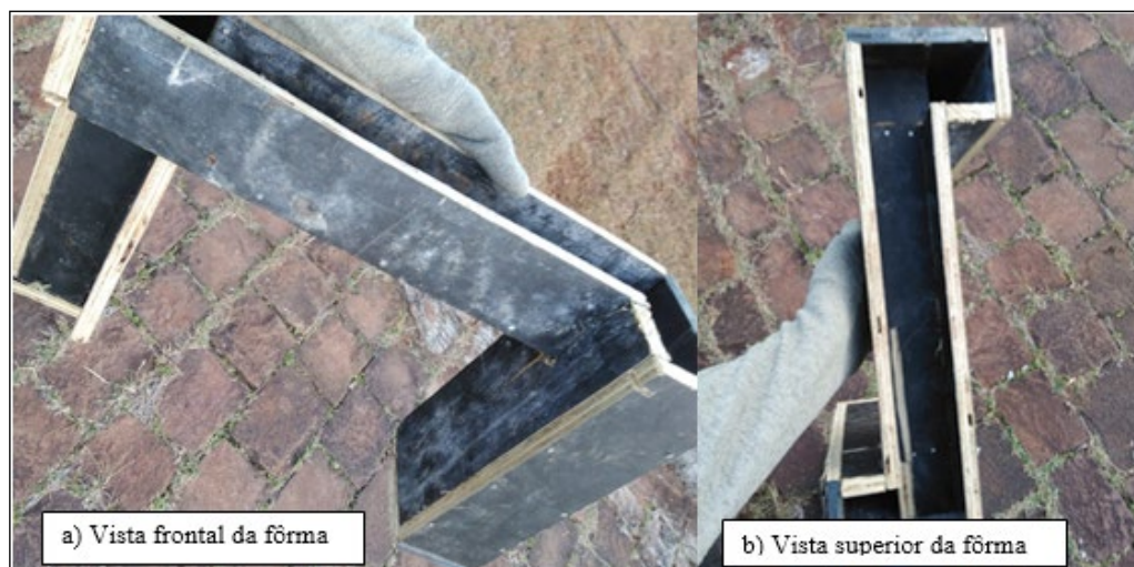
Figura 3 – Vista frontal e superior da fôrma do pórtico

Com o traço e a armadura a serem utilizados determinados, houve a confecção da fôrma de madeira para o APO. Esta fôrma foi executada com compensado. A fôrma deveria ser feita com precisão, pois ela determinaria as dimensões finais do APO, e este, se não estivesse de acordo com o edital, poderia ser desclassificado.