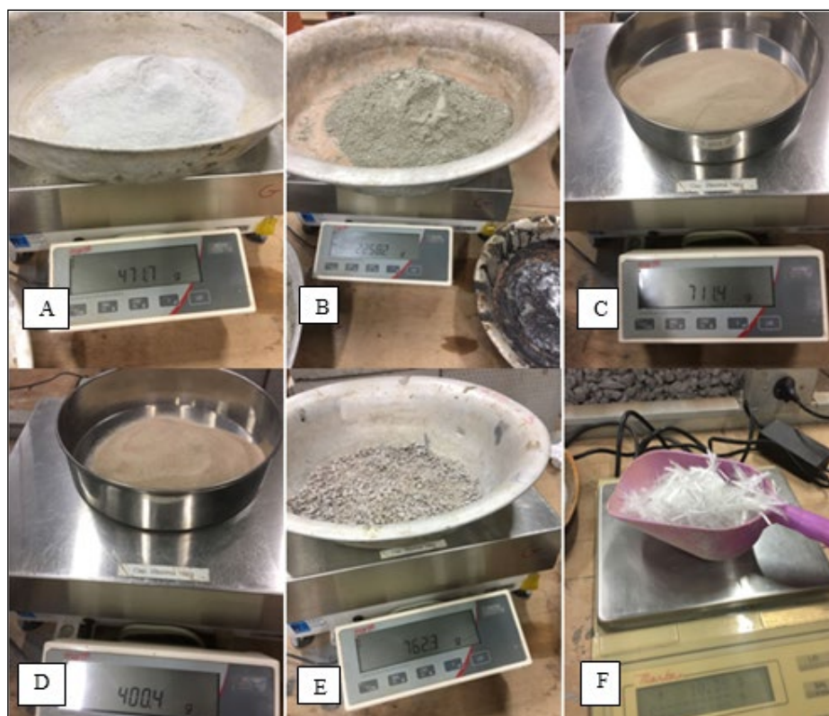
Figura 1 – Materiais utilizados para a confecção do concreto

Os materiais utilizados para a confecção do APO e suas características, atendendo aos requisitos exigidos pelo regulamento da competição, apresentam-se na Figura 1.