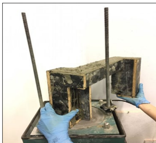
Figura 4 – Fôrma posicionada no adensador vibratório

A concretagem foi realizada em laboratório com a utilização de uma argamassadeira. Foram depositados todos os materiais, pouco a pouco, no recipiente até o adensamento correto do concreto, que foi colocado na fôrma com a armadura já posicionada e, posteriormente, adensado no adensador vibratório, conforme ilustra a Figura 4.