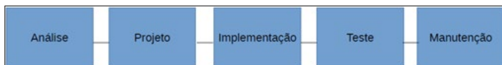
Figura 1 – Processo de software genérico