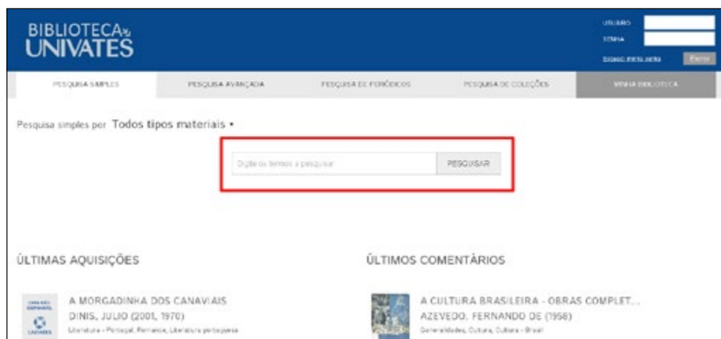
Figura 4 – Tela de busca simples