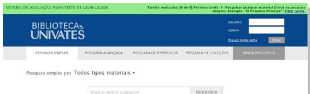
Figura 9 – Navegação durante os testes

fosse completada, a próxima era automaticamente exibida. A opção de pular também estava disponível para o caso do usuário testador não conseguir desempenhar a atividade.