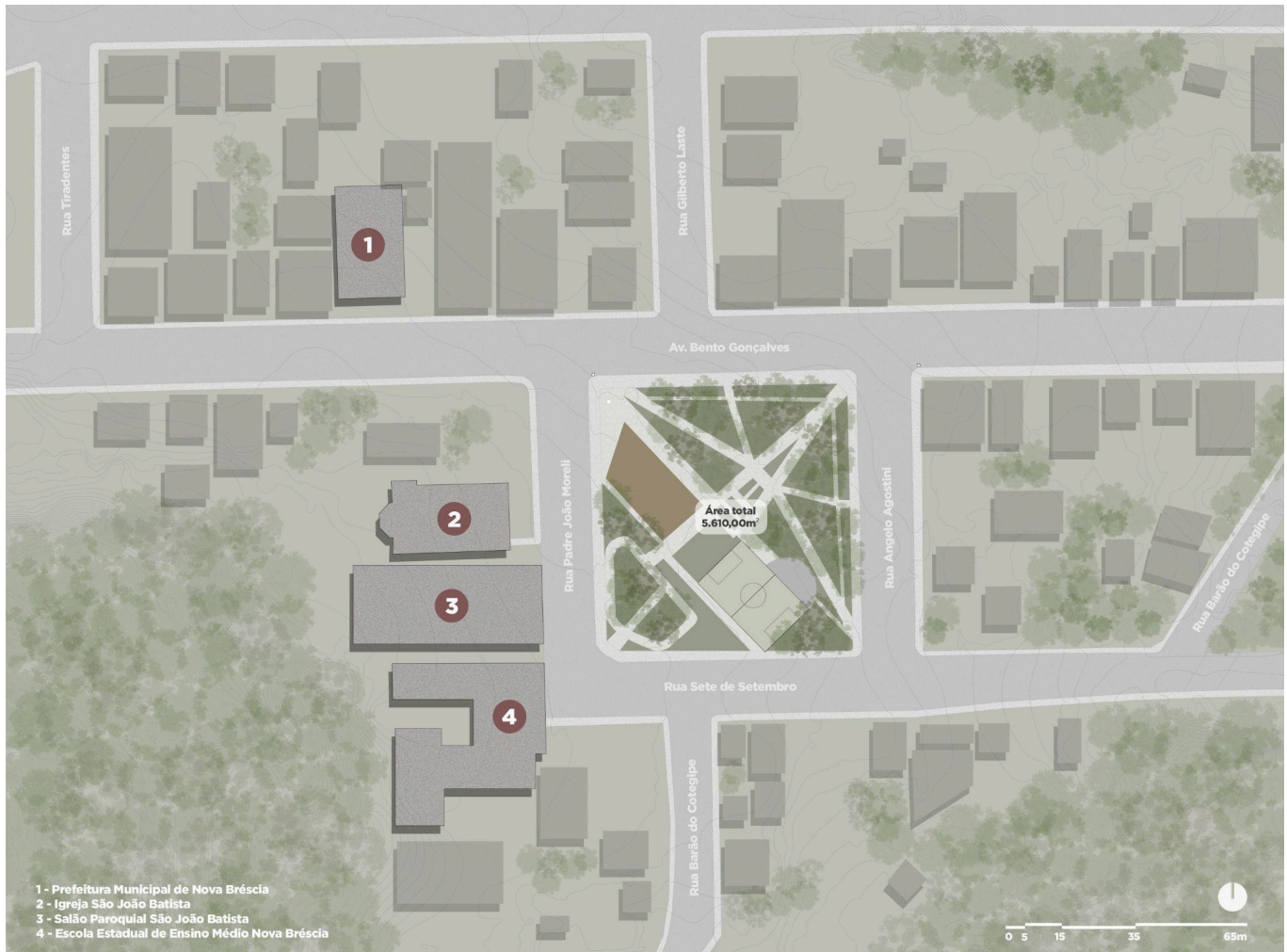
Mapa de referência com área da proposta (escala gráfica)

Os arquivos podem ser encontrados na pasta: https://drive.google.com/drive/folders/12CDxMdTPRPOxnGgGmFZHFxKo1JmL6NKh?usp=sharing