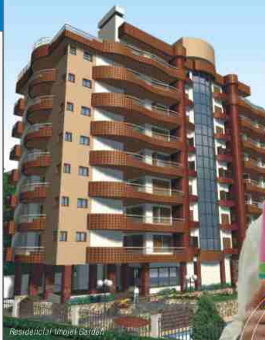
Residencial Lajeado Garden