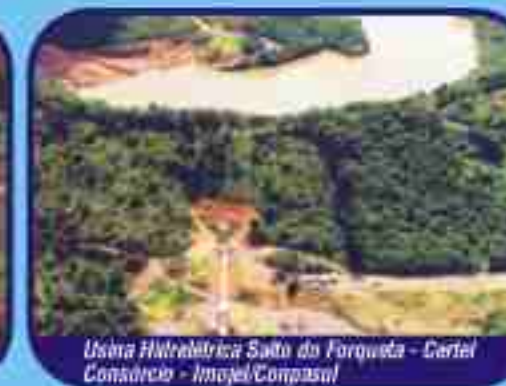
Usina Hidrelétrica Saito do Forqueto - Certej Consórcio - Imojel/Compasul