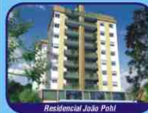
Residencial João Pohl

** Gaúcho the name for people born in Rio Grande do Sul