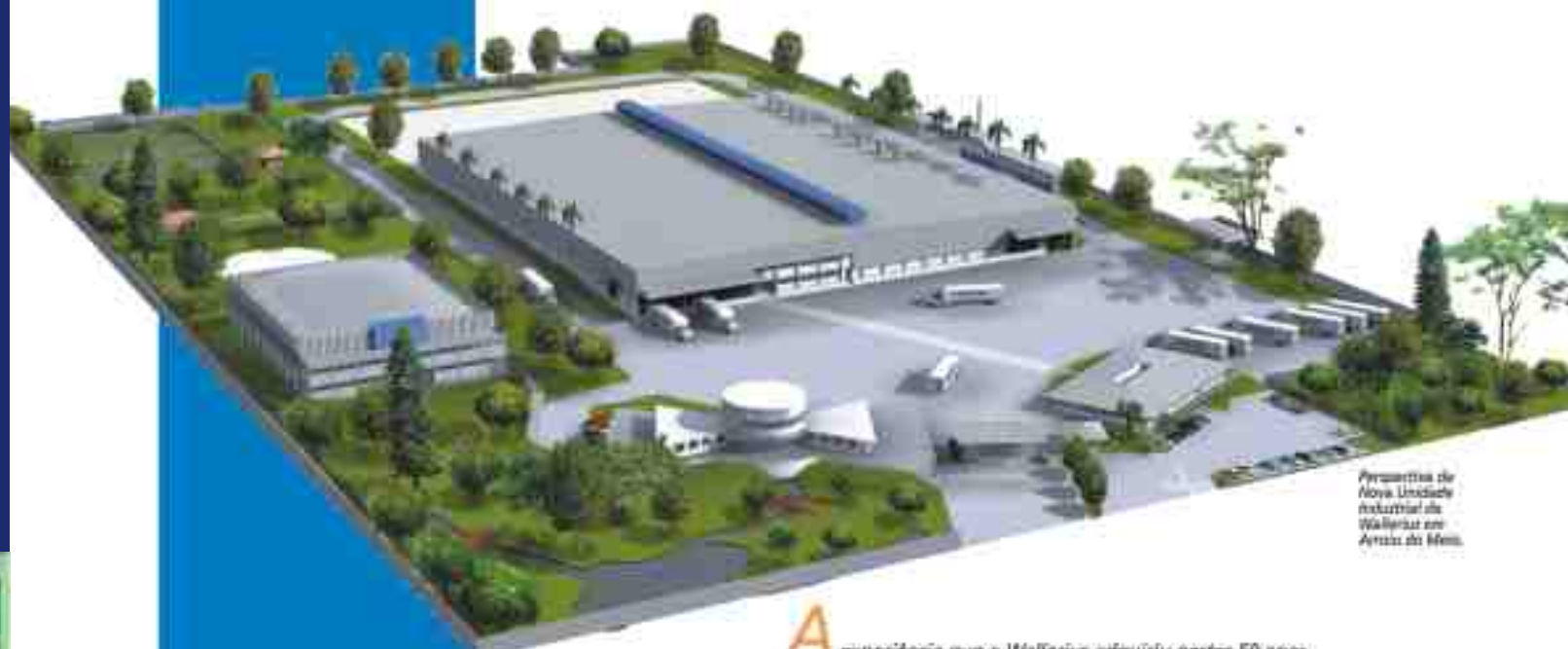
Perspectiva da Nova Unidade Industrial da Wallerius em Araxós do Meio.

Uma empresa moderna com 50 anos de experiência que tem orgulho da sua terra e da sua gente .