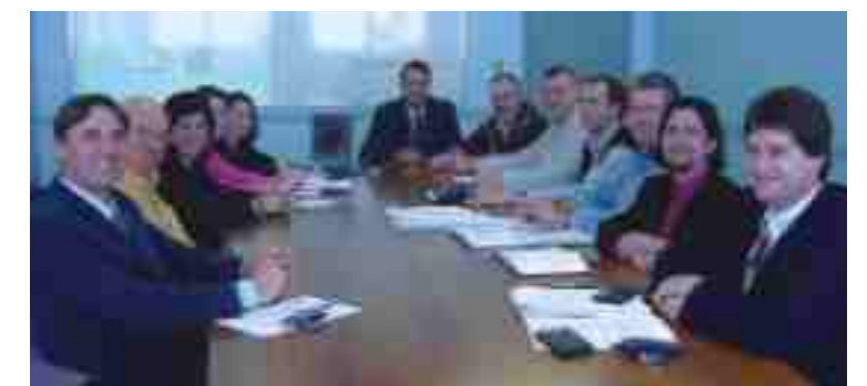
Comitê Editorial e Executivo da revista Valores do Vale

Boa leitura, e sinta-se à vontade para enviar suas sugestões de melhoria para o próximo número, pois a construção da segunda edição começa agora.