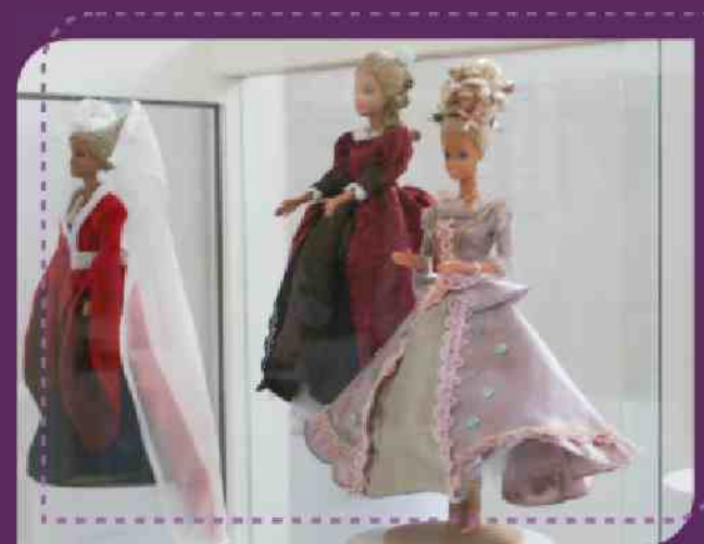
Exposição "Flash Back estrelando Barbie", desenvolvida por alunas da disciplina de História da Moda e da Indumentária I

Pessoas que atuam no setor têxtil e de vestuário e já desenvolvem trabalhos de moda dentro das suas diferentes formas de atuação, bem como pessoas que possuem interesse em criação, desenvolvimento e produção de moda e objetivem atuar no mercado ou realizar estudos na área.